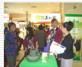
出展企業各社によるデモンストレーション