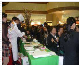
中部地区の食材を生かした 中華風料理の実演デモ及び 試食提供