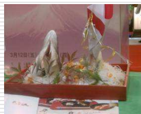
日本産鯛の姿造り、日本酒(丸石醸造 徳川家康)